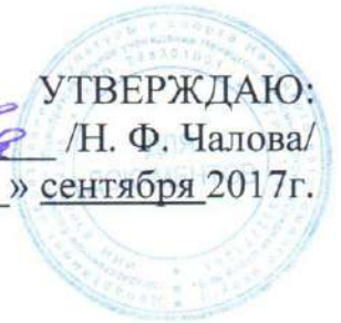
ГРАФИК РАБОТЫ Совета профилактики школы на 2017-2018 учебный год